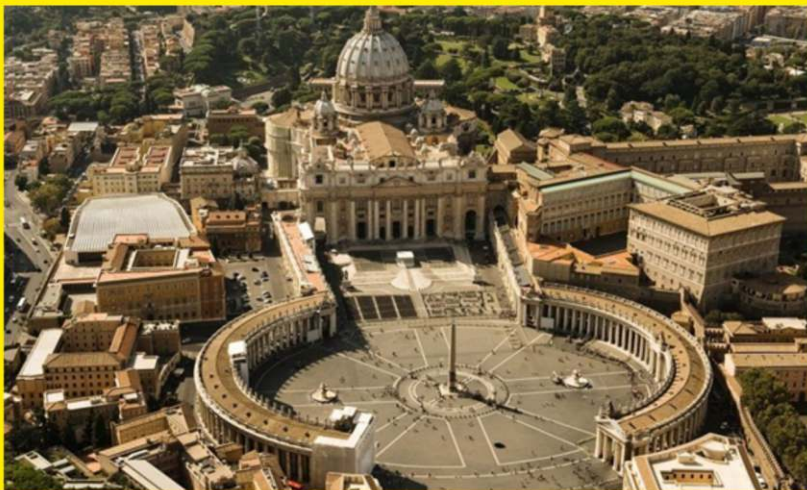
Bazilica Sfântul Petru din Roma